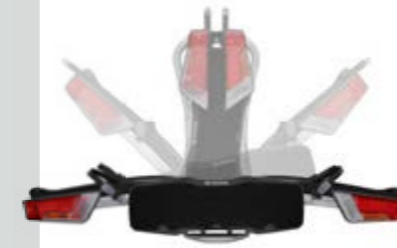
THULE HECKFAHRRADTRÄGER, FALTBAR