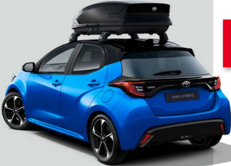
DACHBASISTRÄGER INKL. DACHBOX M