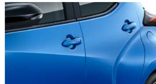
SCHUTZFOLIEN TÜRGRIFFMULDEN, TRANSPARENT