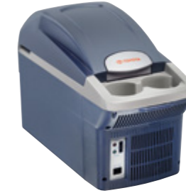
KÜHLBOX 7,5 LITER