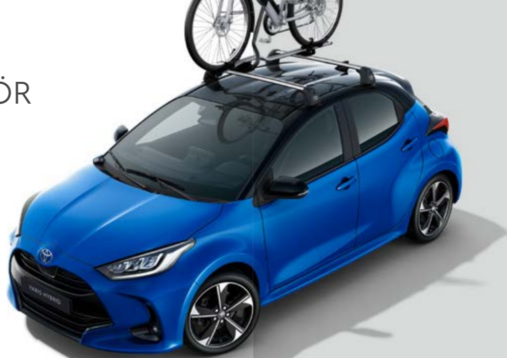
DACHBASISTRÄGER INKL. FAHRRADTRÄGER PRORIDE

Maßgeschneidertes Zubehör in 100%iger Toyota Qualität setzt interessante Akzente und bringt Ihre Individualität noch besser zum Ausdruck.