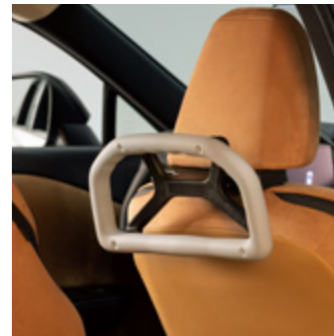
HALTEGRIF FÜR DIE KOPFSTÜTZE ADVANCED