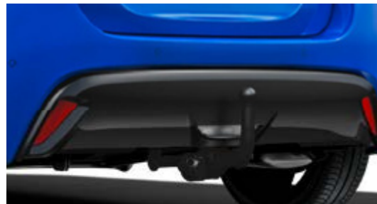
ANHÄNGEZUGVORRICHTUNG INKL. 13-POLIGEM E-SATZ