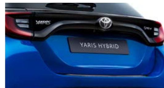
LADEKANTENSCHUTZ, AUS KUNSTSTOFF, SCHWARZ