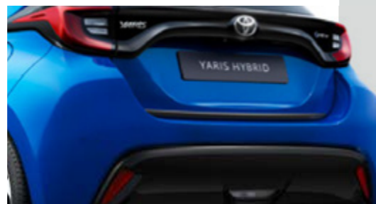
UNTERE HECKKLAPPEN-ZIERLEISTE, SCHWARZ