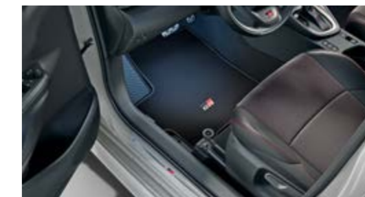
FUSSMATTEN, VELOURS MIT GR-LOGO

Weitere Informationen zu unserem TOYOTA ORIGINAL ZUBEHÖR finden Sie in unseren Preislisten oder auf toyota.de . Einfach den QR-Code scannen und Topangebote entdecken.