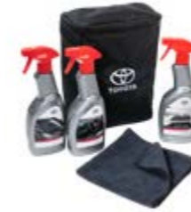
TOYOTA CARE KIT