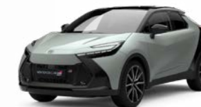
2VF dynamic grey metallic 2)