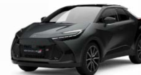
2NB marlingrau metallic 2)