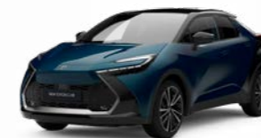
2YB dunkel türkisblau metallic 2)