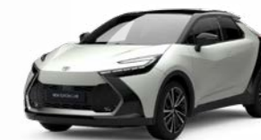
2VP platinumweiß perleffekt 2)