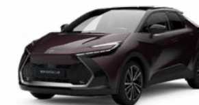
2XE dunkel amethyst metallic 1)