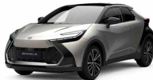
2MR cosmic silber metallic 2)