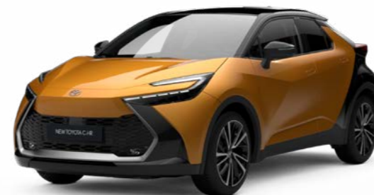
2YT sulfurgold metallic 2)