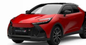
2TB karminrot metallic 1)