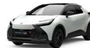
2MQ schneeweiß 1)