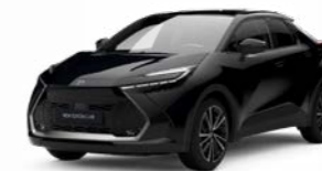
209 mysticschwarz mica 2),3)