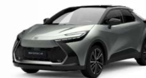
2VU shimmering silber metallic 1)