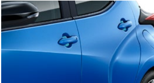
SCHUTZFOLIEN TÜRGRIFFMULDEN, TRANSPARENT