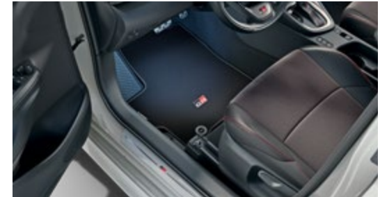
FUSSMATTEN, VELOURS MIT GR-LOGO