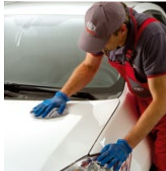
LANGZEITKAROSSIERESCHUTZ TOYOTA PROTECT