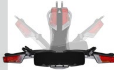
THULE HECKFAHRRADTRÄGER, FALTBAR