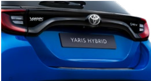
LADEKANTENSCHUTZ, AUS KUNSTSTOFF, SCHWARZ