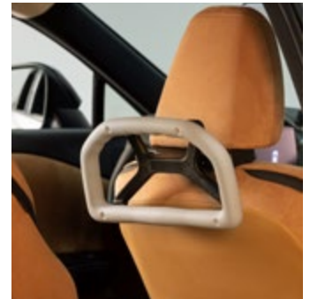
HALTEGRIF FÜR DIE KOPFSTÜTZE ADVANCED