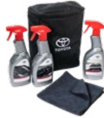
TOYOTA CARE KIT