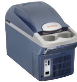
KÜHLBOX 7,5 LITER